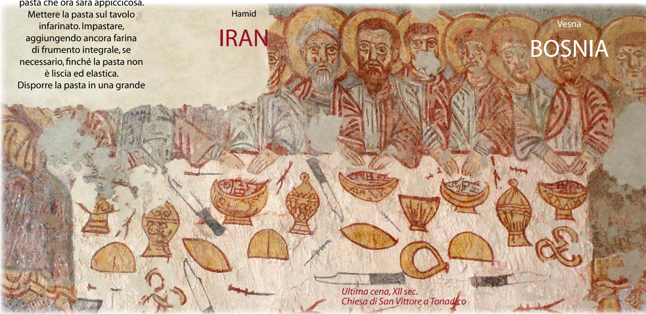
Ultima cena, XII sec. Chiesa di San Vittore a Tonadico